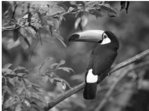
Figura 1 – Espécie rara de tucano

As ilustrações são imagens que acompanham o texto. Podem ser de diversos tipos: desenhos, gravuras, esquemas, fluxogramas, fotografias, gráficos, mapas, organogramas, plantas, quadros, retratos, etc. As figuras abaixo apresentam alguns exemplos de ilustração.