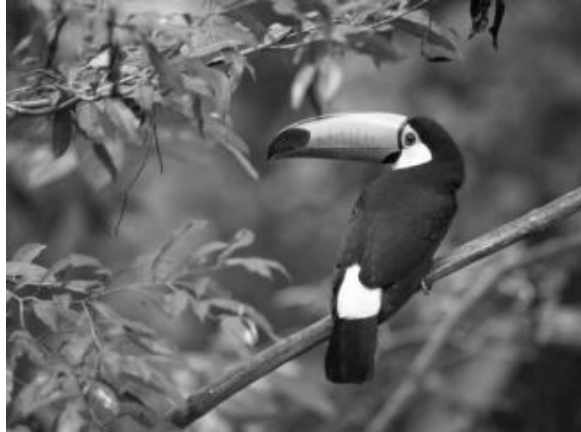
Figura 1 – Espécie rara de tucano (fonte 12 – estilo “Legenda”)

Fonte: Moore e Agur (1996, p. 110). (fonte 10 – estilo “Fonte”)